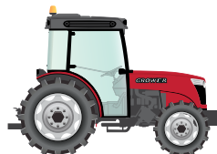
90 to 120 hp