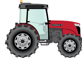
220 to 280 hp