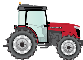
160 to 180 hp