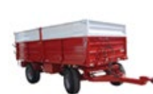
Trailers / Remolques