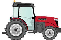
130 to 150 hp