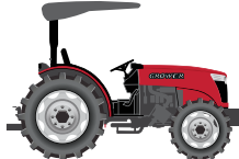
55 to 80 hp