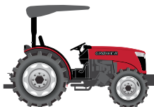
55 to 80 hp