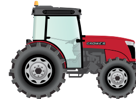
220 to 280 hp