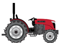
25 to 50 hp