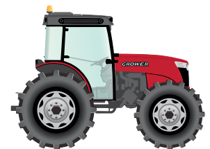
360 to 440 hp