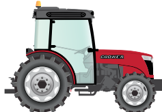
90 to 120 hp