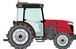
130 to 150 hp