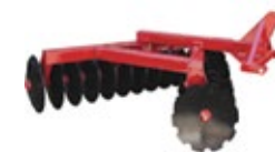
Disc Harrows / Gradas de discos