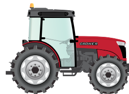
160 to 180 hp