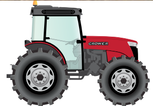
360 to 440 hp